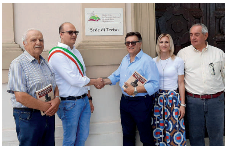
Apposizione targa Centro Studi a Treiso