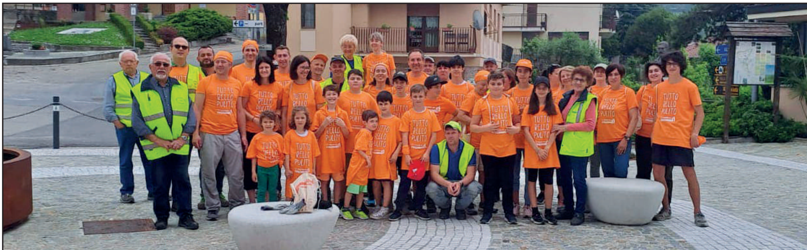
Spazzamondo 2023 - Grazie di cuore a tutti i partecipanti

Sabato 16 dicembre , a Castagnole delle Lanze, si è tenuta la cerimonia di premiazione del Premio Nazionale "Terre, lavoro, paesaggio e sport". Questo premio nasce per ringraziare figure e personalità che hanno contribuito, con il loro lavoro, successo e professionalità alla valorizzazione culturale del territorio.