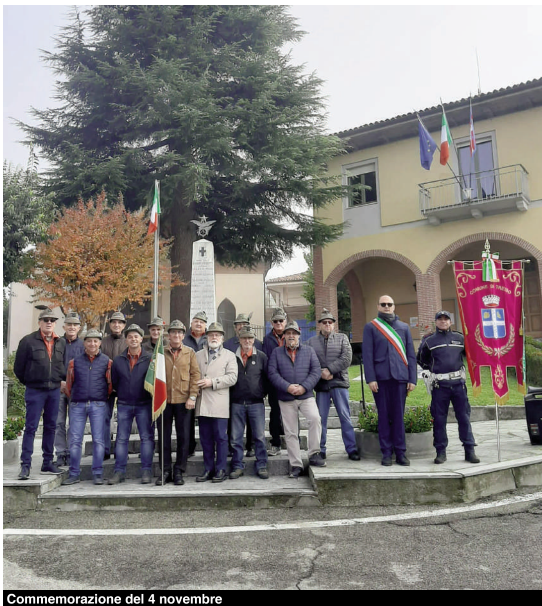
Commemorazione del 4 novembre

Il gruppo alpini di Treiso, quest'anno ha ripreso appieno le sue attività iniziando con il gran fritto misto alla piemontese il 4 marzo; sospeso per qualche anno a causa della pandemia. Il 2023 ci ha regalato l'emozione di portare nel nostro paese la 13ª edizione di "Alpini in Langa" il 22 e 23 Aprile, svol-