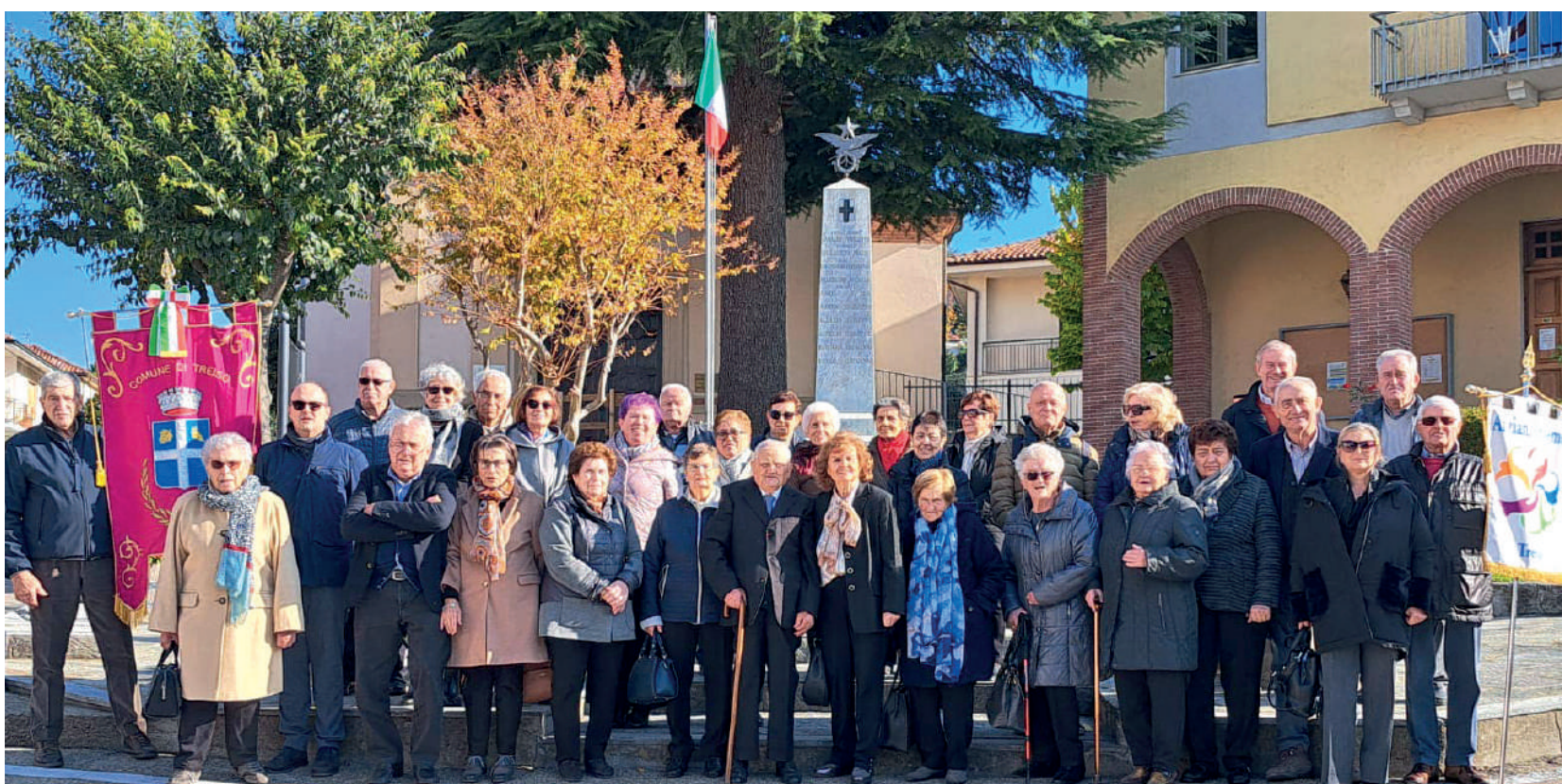
Festa dei nonni 2023

E' in via di definizione la serata del 31 dicembre.