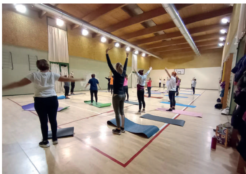
Ginnastica dolce in palestra