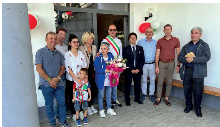
Inaugurazione nuovo circolo Bastian Contrario