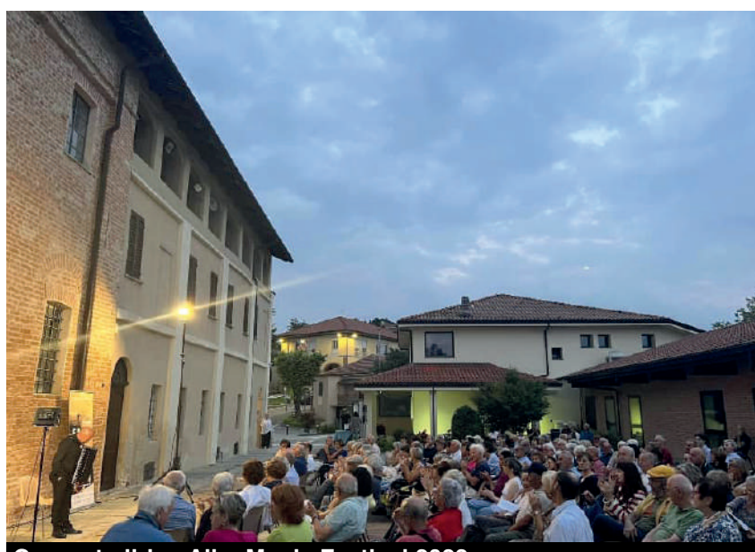
Concerto lirico Alba Music Festival 2023