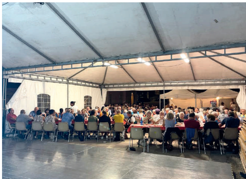
Festa vendemmiale 2023