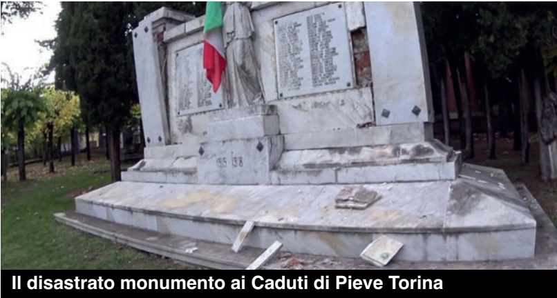
Il disastroso monumento ai Caduti di Pieve Torina

Noi vogliamo ringraziarli tutti perchè hanno dedicato tanto tempo e hanno creato un gruppo che si è particolarmente distinto. Li ringraziamo anche per il loro ultimo gesto, quello di portare il ricavato delle ultime due cene, ai terremotati del centro Italia, nel comune di Pieve Torina.