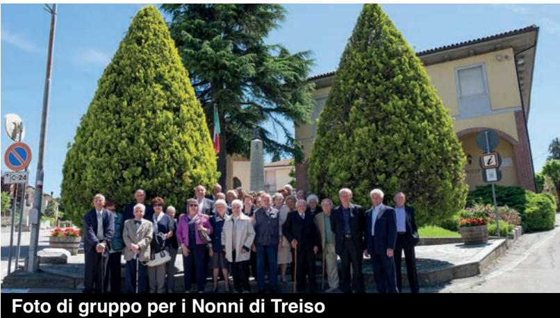
Foto di gruppo per i Nonni di Treiso