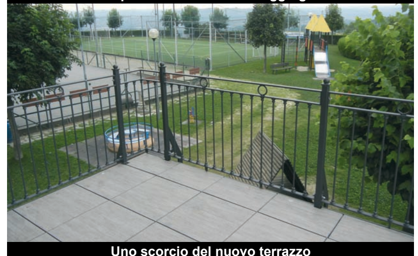
Uno scorcio del nuovo terrazzo