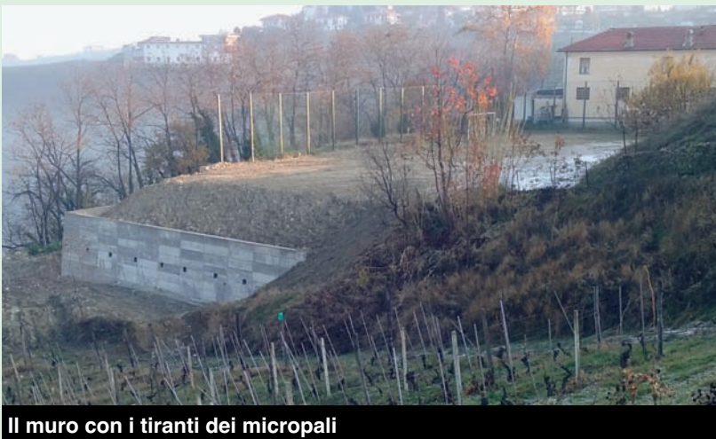
Il muro con i tiranti dei micropali

• Dobbiamo sostituire il Server per i computers del Municipio. I lavori per la realizzazione della linea di collegamento inizieranno molto presto e poi si collegherà il nuovo Server per mettere i computers in regola per le nuove disposizioni che obbligano i Comuni a fare tutto "online": il costo si aggirerà in totale sui 7.000 euro.