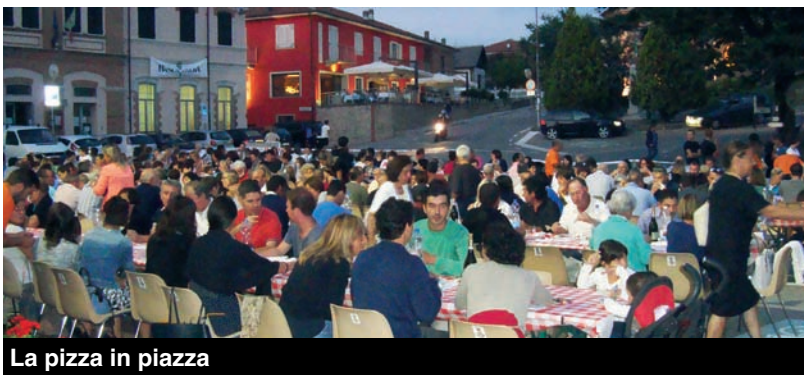
La pizza in piazza